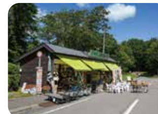
物産販売店(湧水口側)

公園内には、名水プラザのほかにも 名水市場や物産販売店があります。 名水にこだわった甘味処をはじめ、ファームがつくるソフトクリーム、人気の 自家焙煎珈琲など、軒を連ねるショップのラインナップは多彩。また、水タンク の販売や台車の貸し出しも行って います。