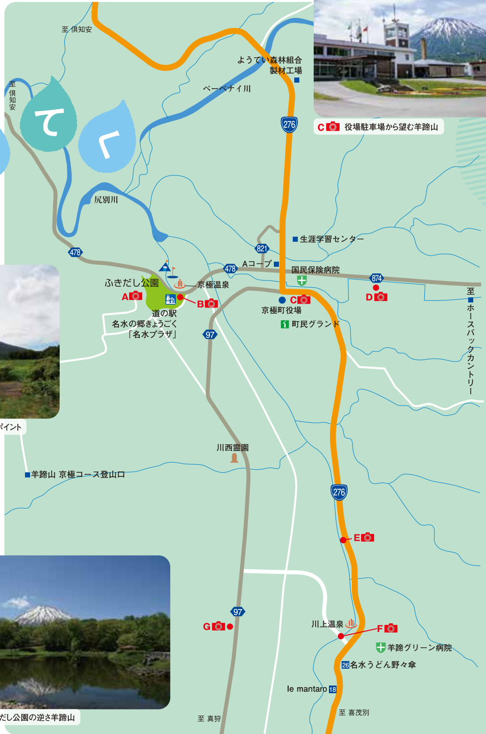
C 📷 役場駐車場から望む羊蹄山