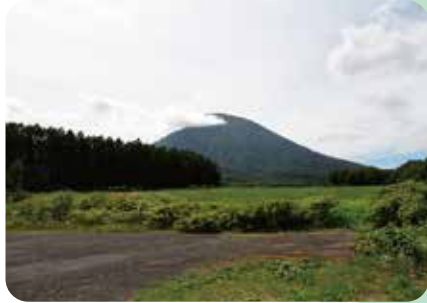
A 📷 ふきだし公園展望台の羊蹄山ビューポイント