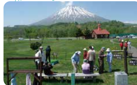
京極パークゴルフ場