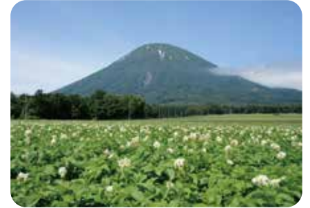
G 📷 羊蹄山とじゃがいも畑