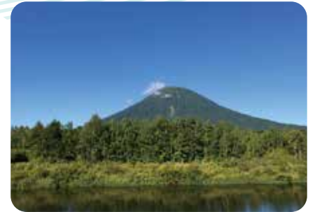
E 📷 尻別川と羊蹄山