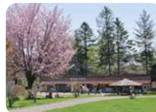
名水市場(名水プラザ横)