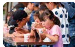
かき氷早食い競争