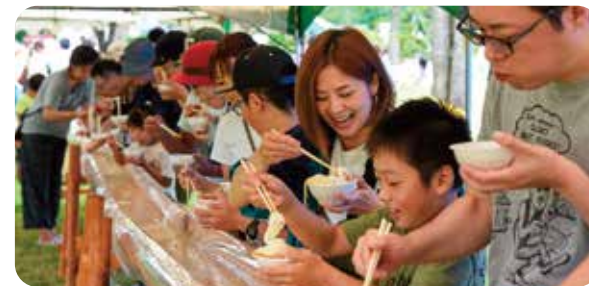
名水流しソーメン