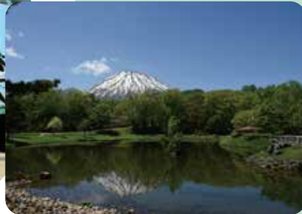
B 📷 ふきだし公園の逆さ羊蹄山