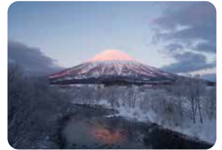
F 📷 尻別川と羊蹄山